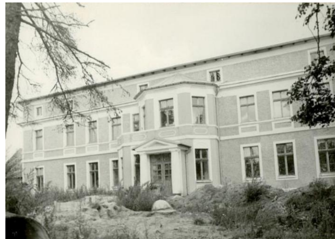
Dwór w 1990 r.

dalsza destrukcja, zrujnowanie, katastrofa budowlana, rozbiórka