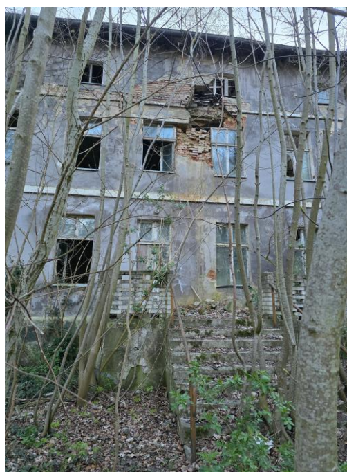
Elewacja parkowa. Widok od wschodu