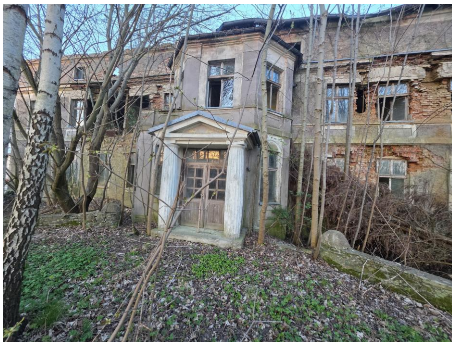
Elewacja frontowa. Widok od zachodu