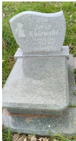
Współczesny nagrobek dziecięcy