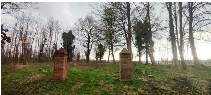
Widok od drogi do Jarkowa

7. Fotografia z opisem wskazującym orientację albo mapa z zaznaczonym stanowiskiem archeologicznym