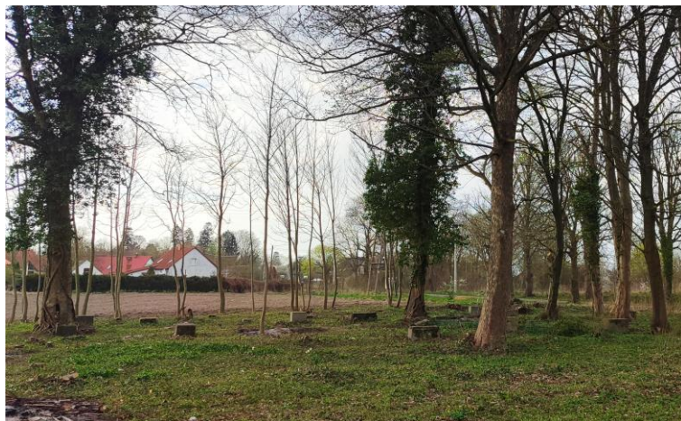
Widok od południowego-wschodu