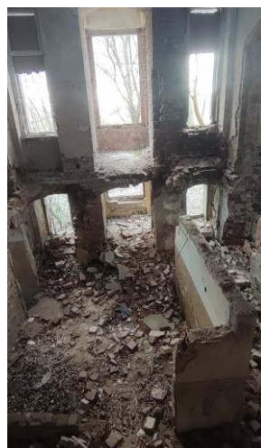
Zarwany strop w sieni