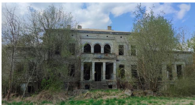
Elewacja frontowa. Widok od południa

7. Fotografia z opisem wskazującym orientację albo mapa z zaznaczonym stanowiskiem archeologicznym