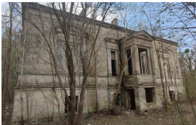
Elewacja boczna. Widok od zachodu