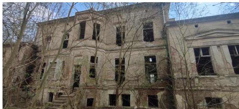
Elewacja ogrodowa. Widok od północnego-wschodu