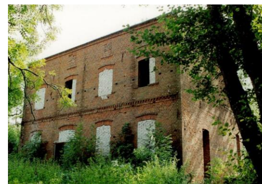
Stan młyna w 2000 r. (,)