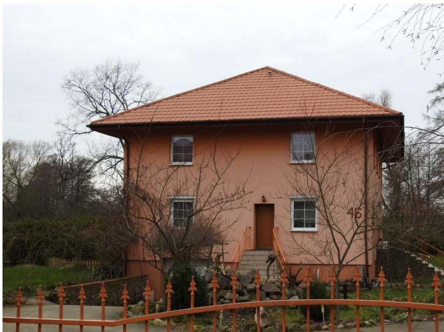
Widok ogólny od południowego wschodu

7. Fotografia z opisem wskazującym orientację albo mapa z zaznaczonym stanowiskiem archeologicznym